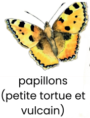
papillons (petite tortue et vulcain)