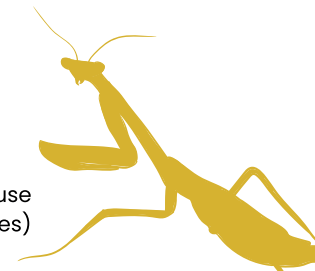
mante religieuse (ordre : Mantoptères)

Il existe au total 25 ordres d'insectes en Europe ... et des milliers d'espèces à travers le monde !